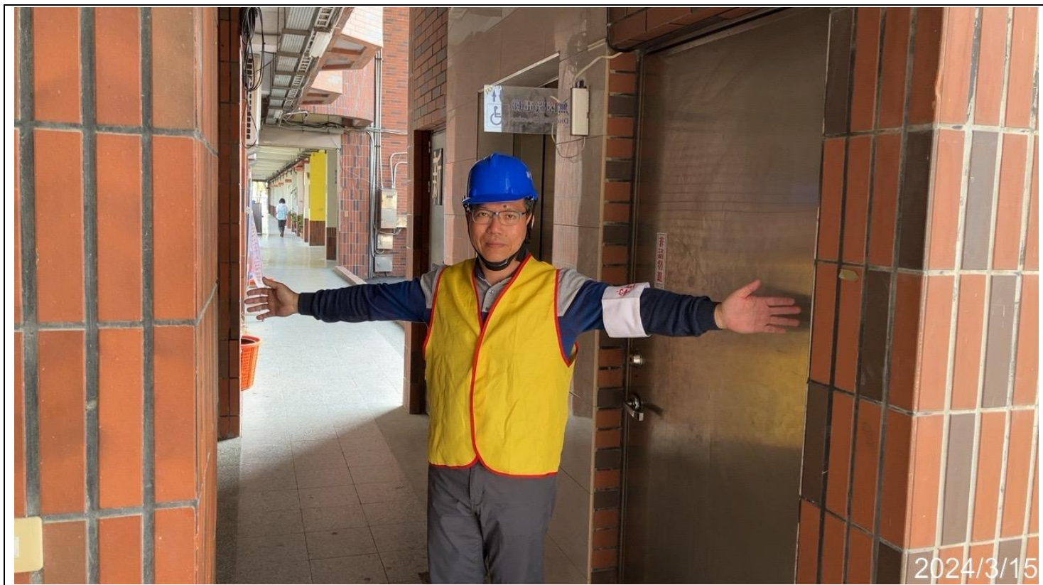
內容說明：避難期間禁止人員搭乘電梯(安全防護班訓練)