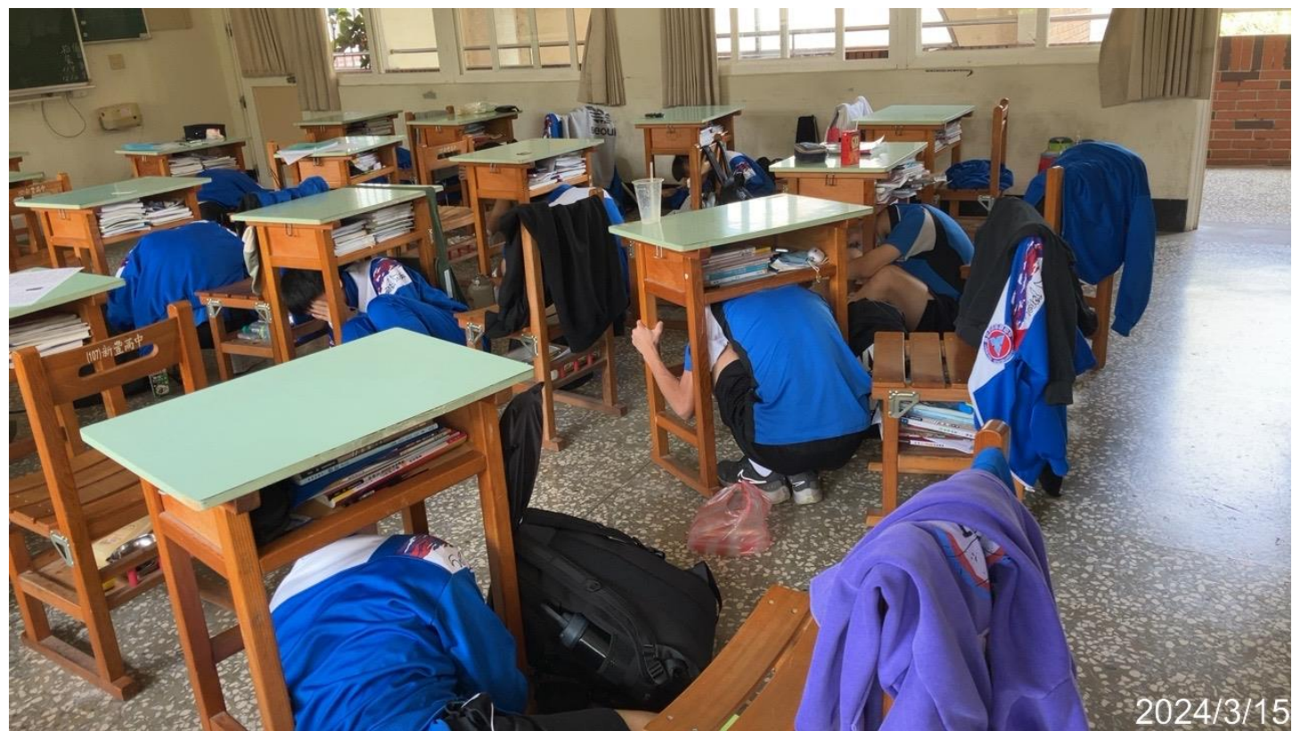
內容說明：配合學務處實施防震演練，於教室內實施就地避難演練