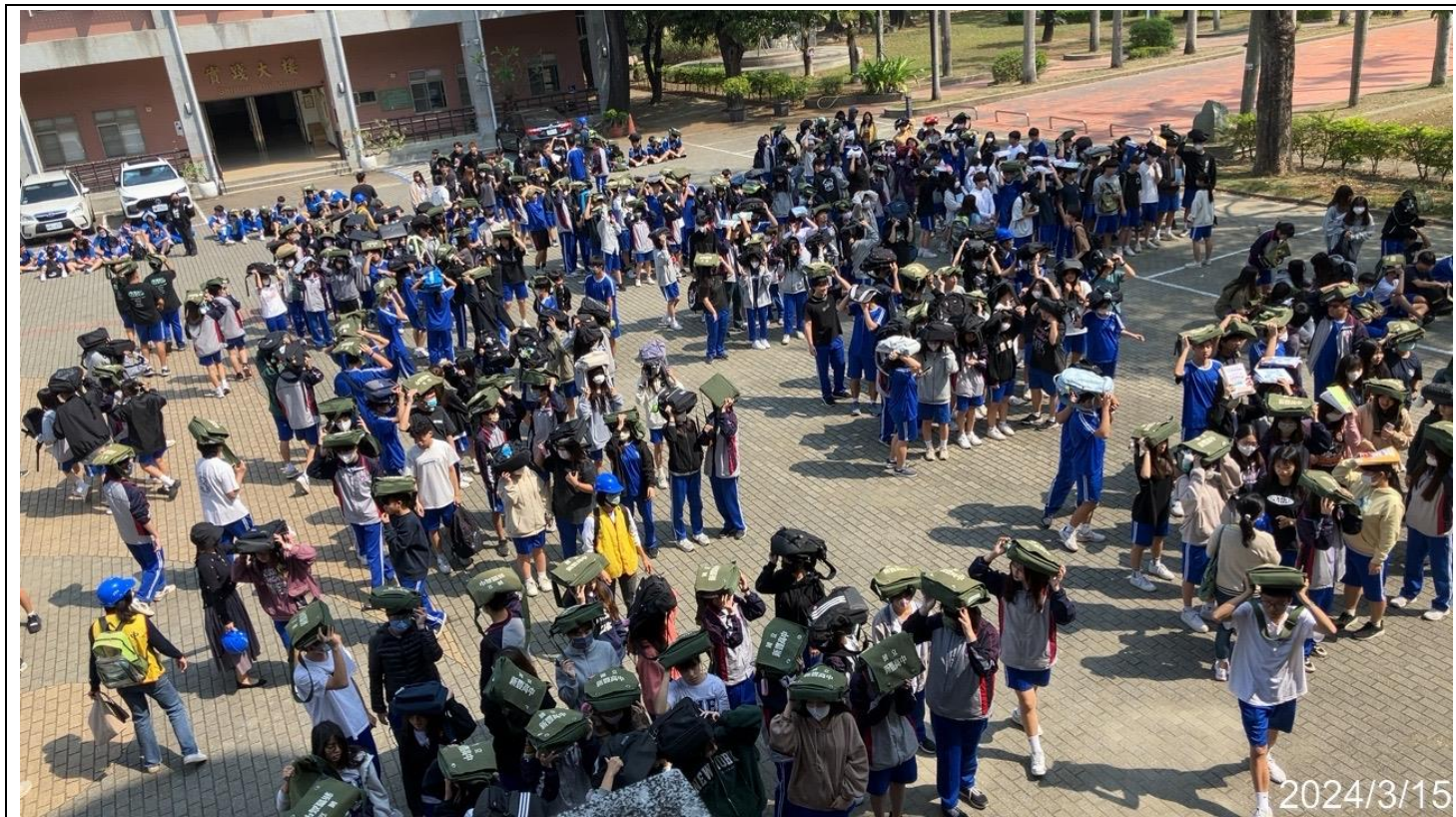
內容說明：所有學生疏散至安全場域集合點名