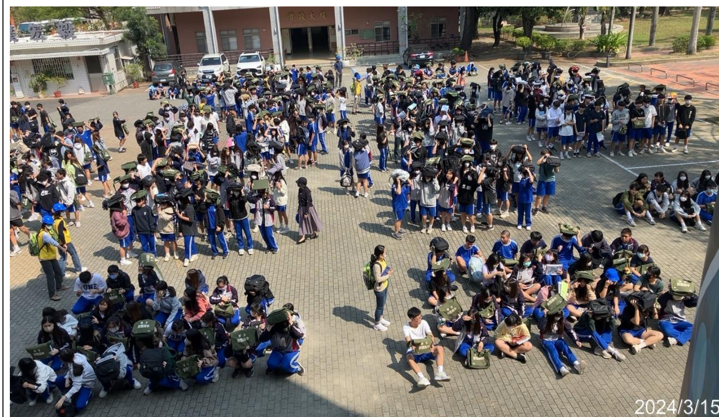
內容說明：所有學生疏散至安全場域集合點名