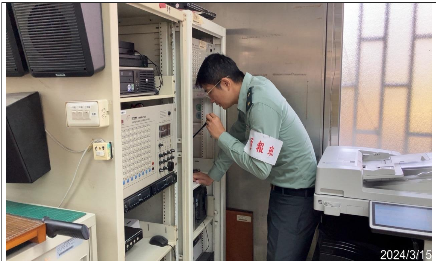
內容說明：於災難發生時進行疏散廣播(通報班訓練)