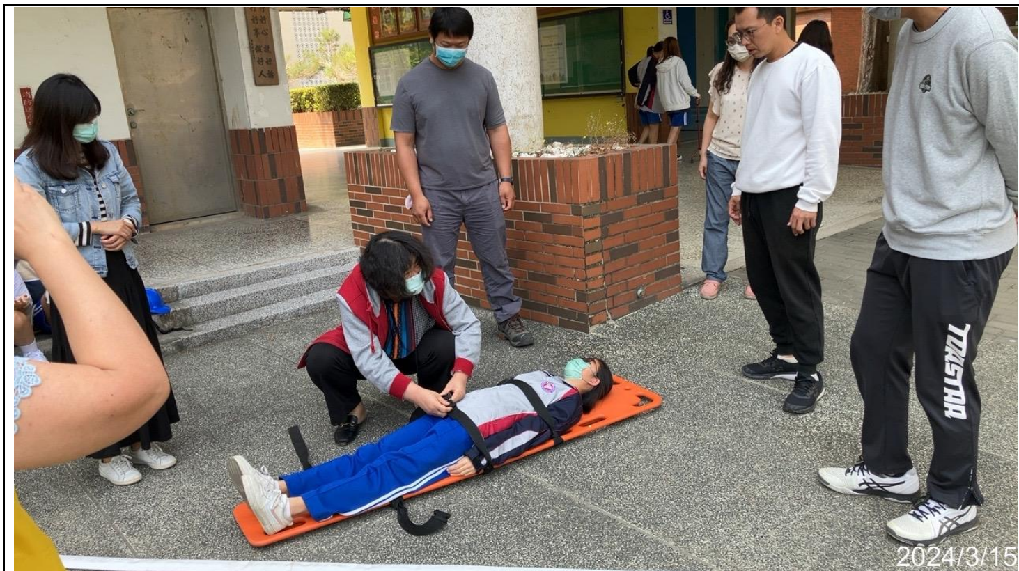
內容說明：將傷者抬至救護擔架上並固定(救護班訓練)