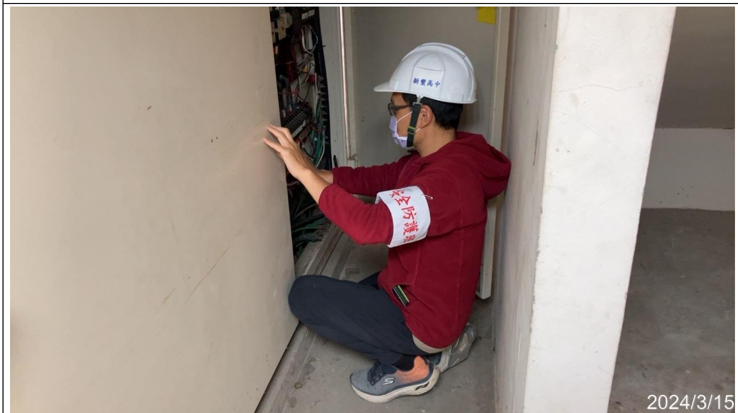
內容說明：災難發生時緊急關閉電源(安全防護班訓練)