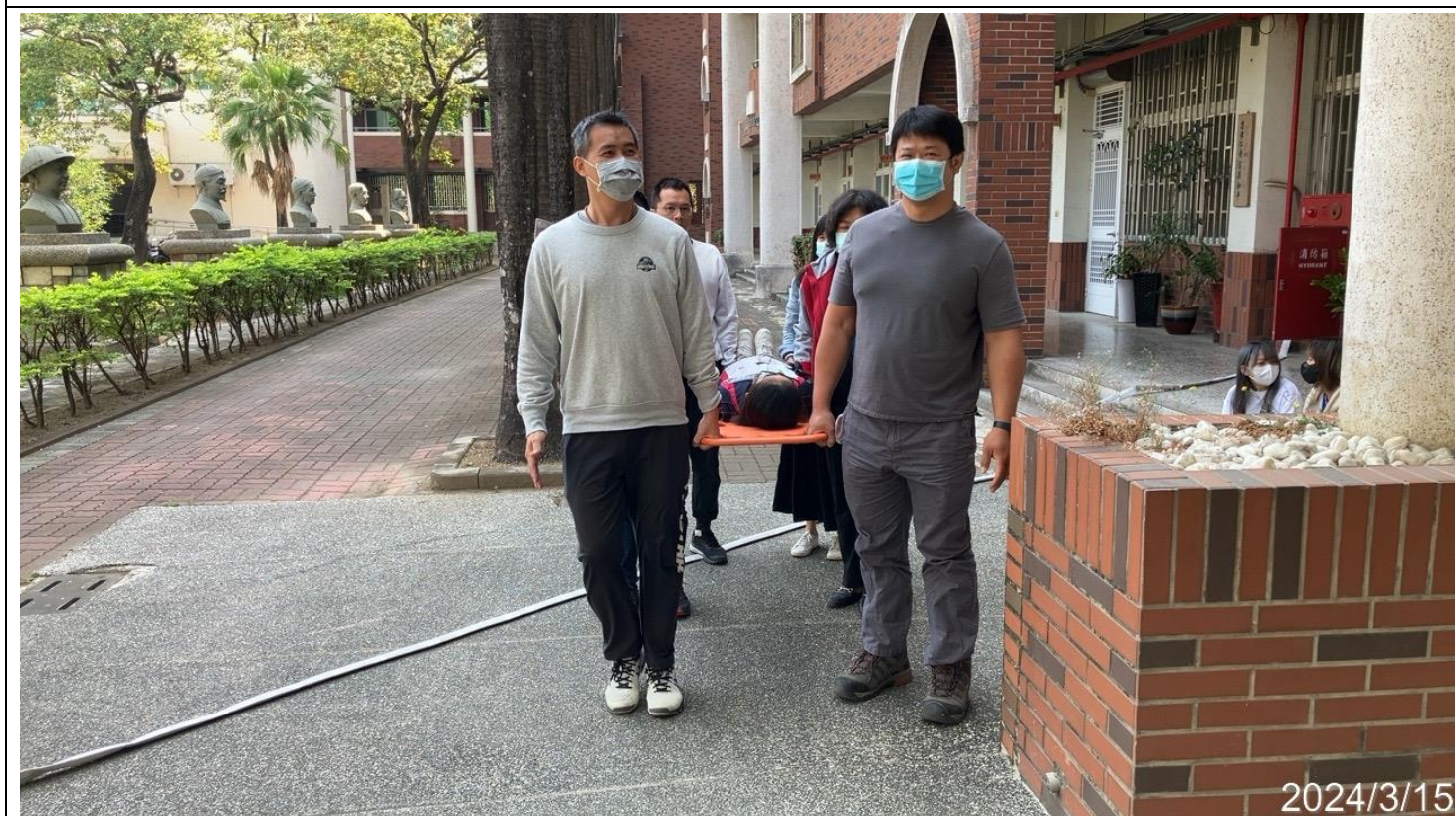
內容說明：利用救護擔架將傷者抬至救護車(救護班訓練)