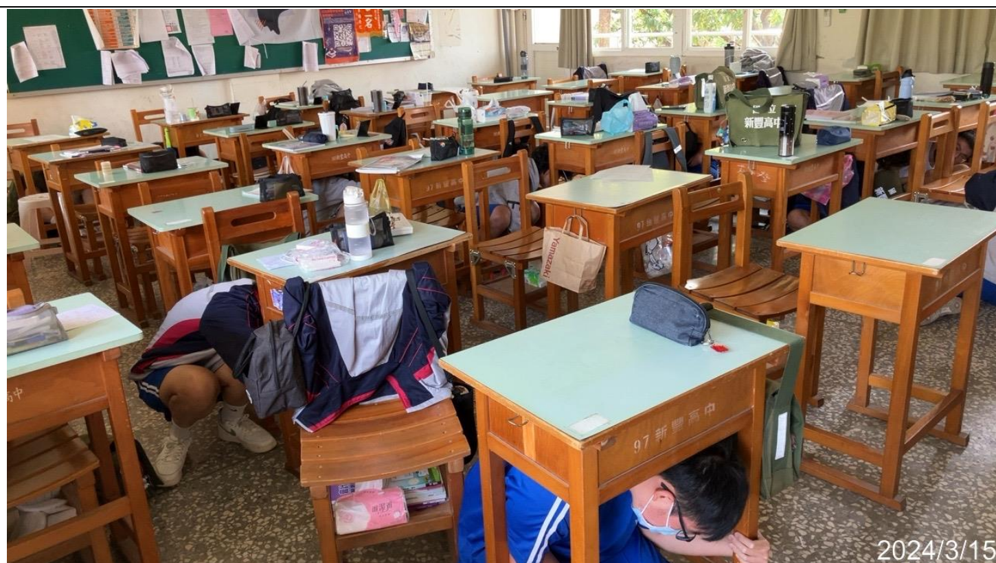
內容說明：配合學務處實施防震演練，於教室內實施就地避難演練