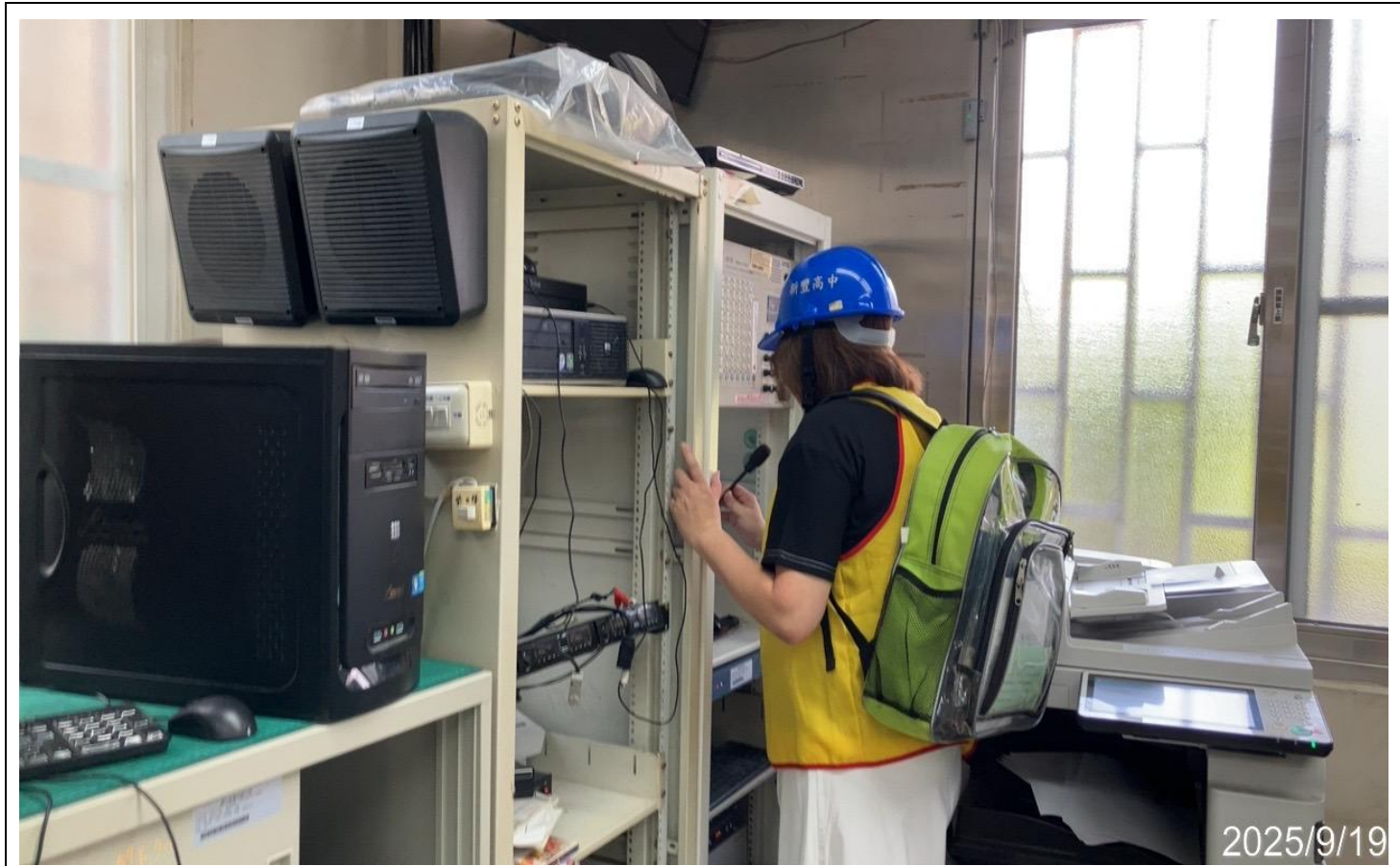
內容說明：於災難發生時進行疏散廣播(通報班訓練)