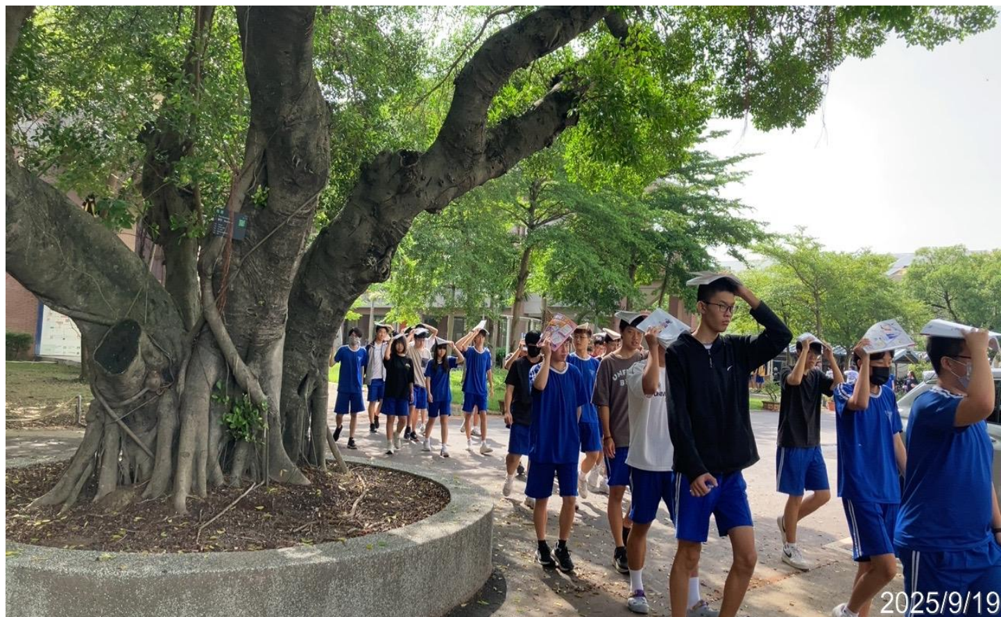
內容說明：引導學生至安全場域疏散(避難引導班訓練)