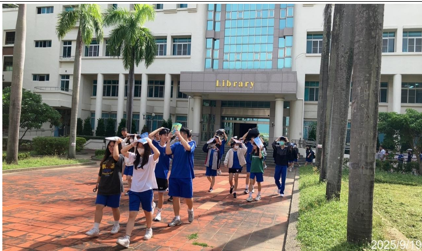
內容說明：引導學生至安全場域疏散(避難引導班訓練)