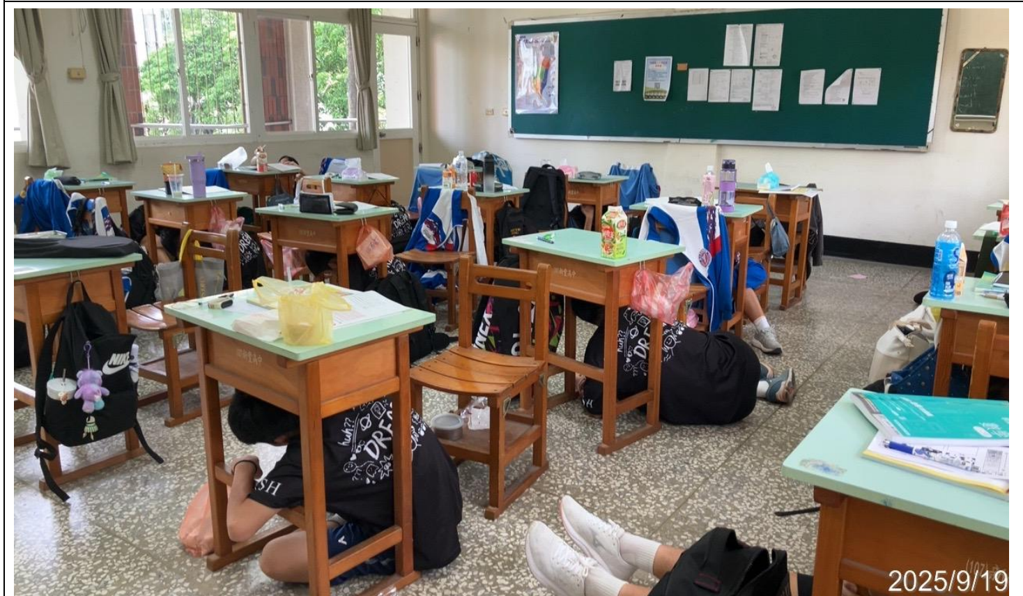
內容說明：配合學務處實施防震演練，於教室內實施就地避難演練