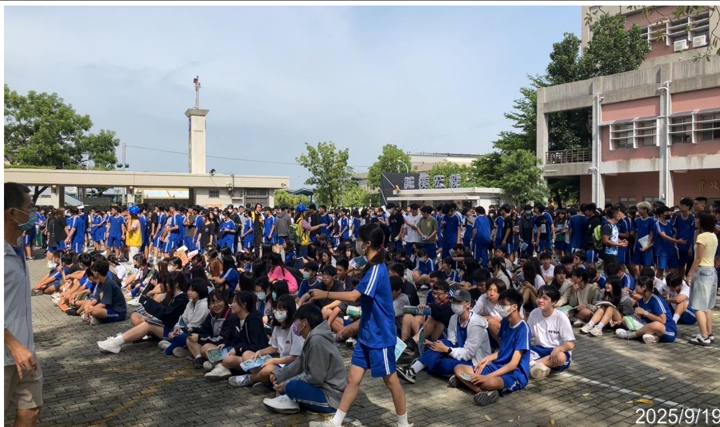
內容說明：所有學生疏散至安全場域集合點名