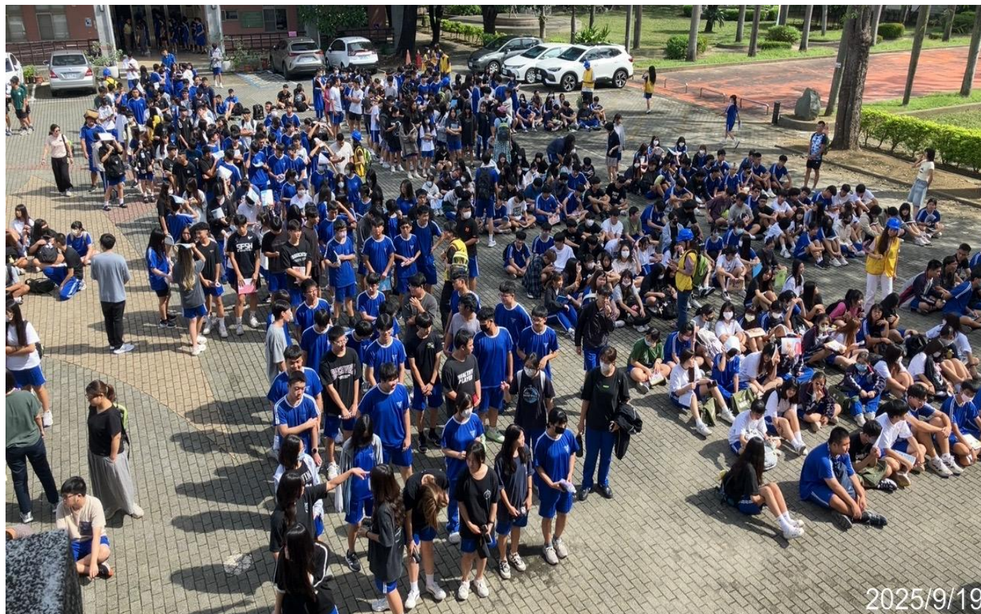
內容說明：所有學生疏散至安全場域集合點名