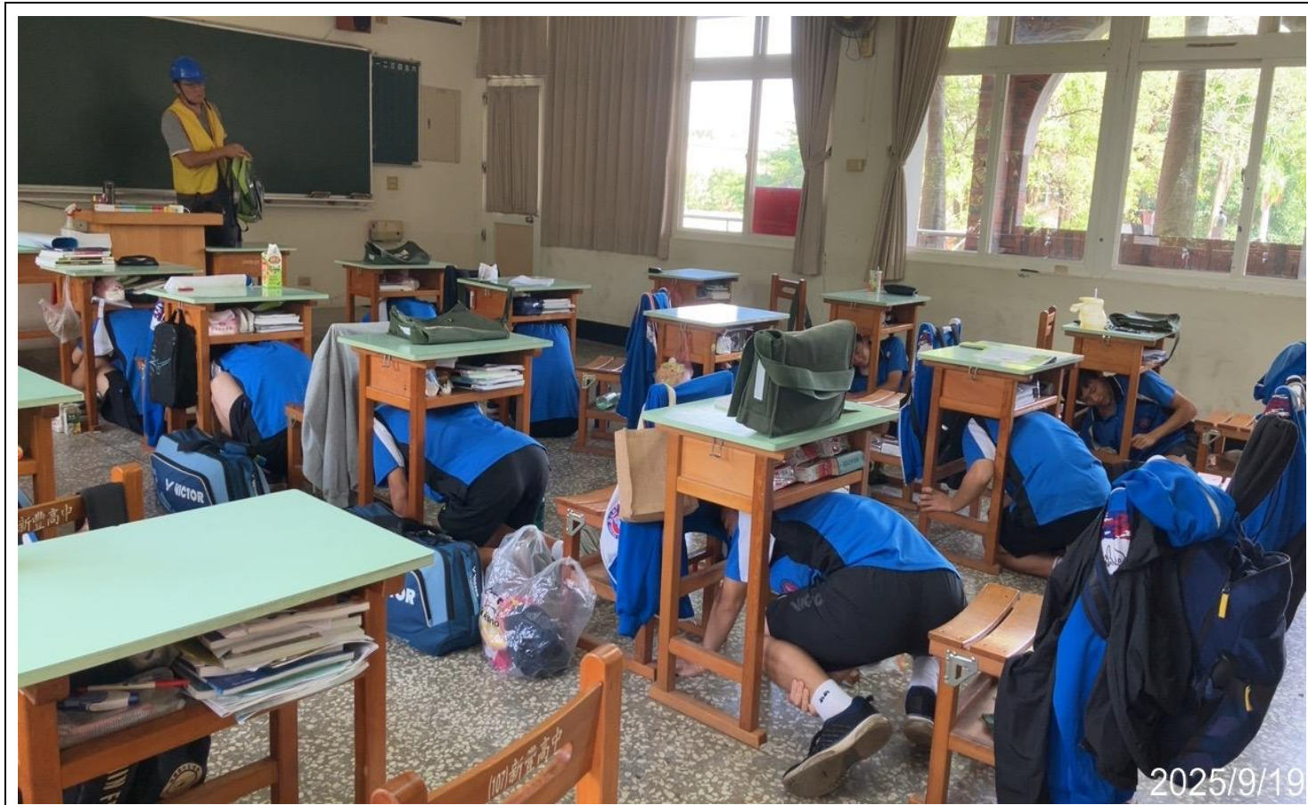
內容說明：配合學務處實施防震演練，於教室內實施就地避難演練