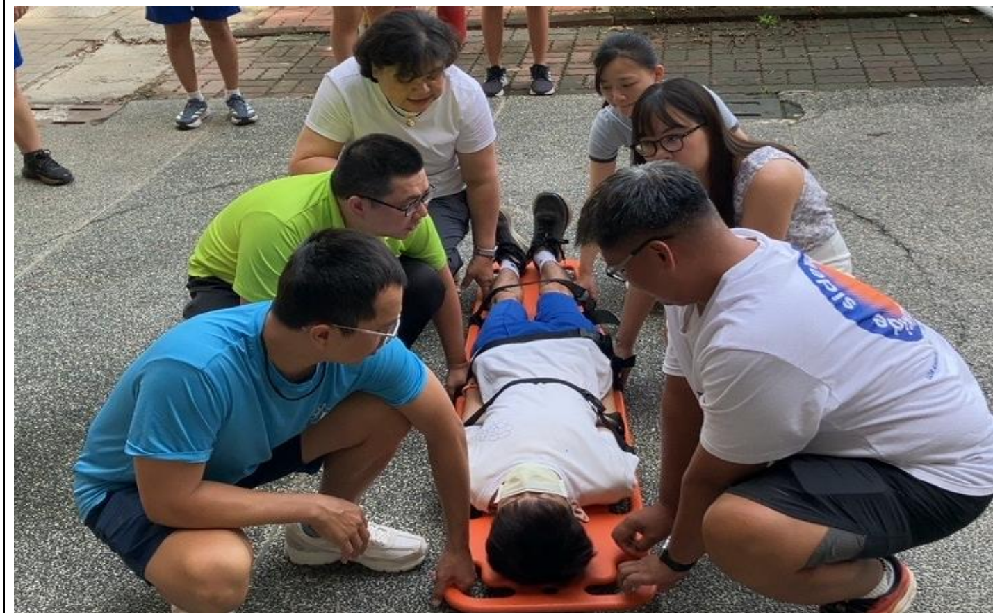
內容說明：將傷者抬至救護擔架上並固定(救護班訓練)