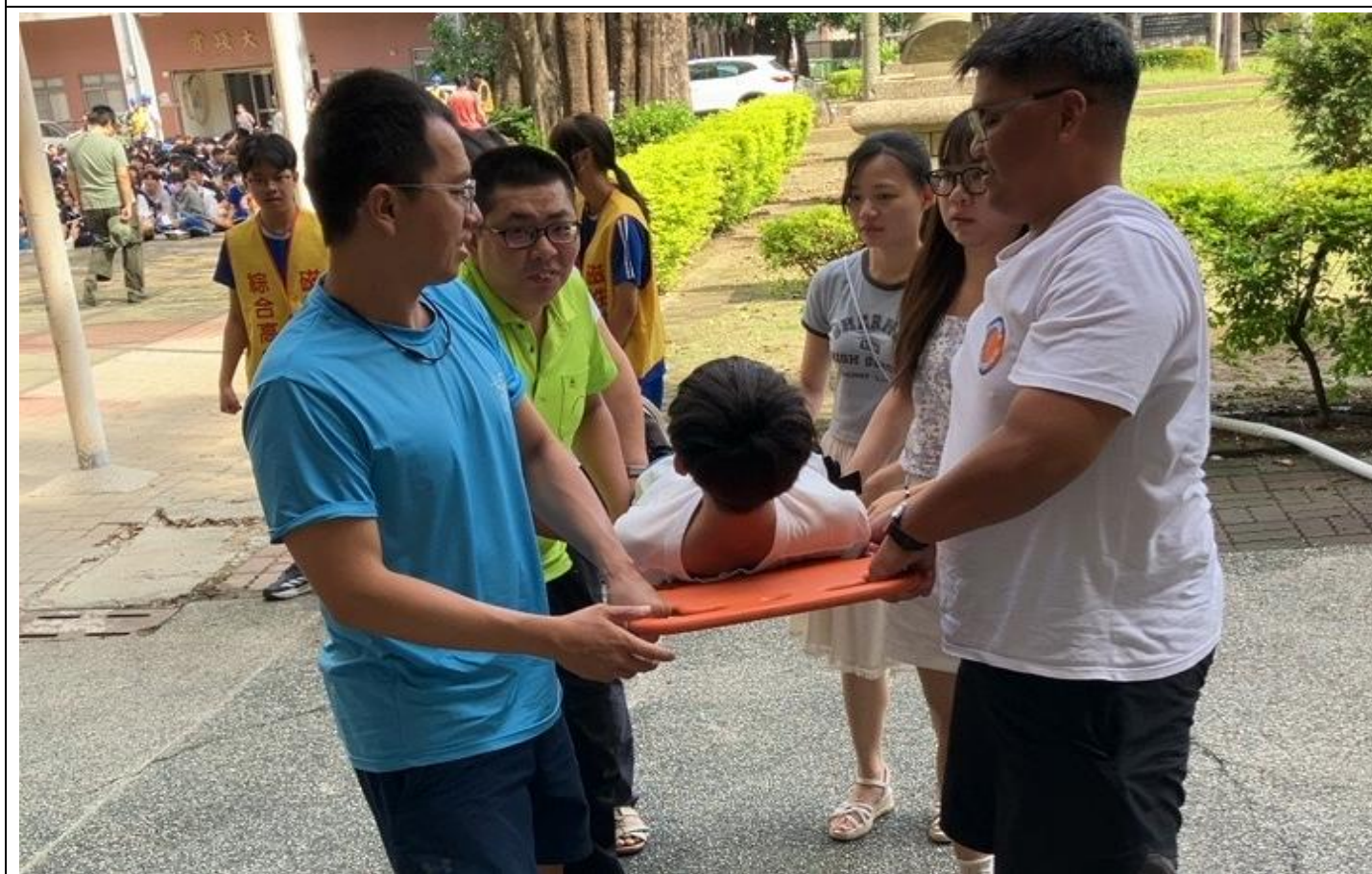
內容說明：利用救護擔架將傷者抬至救護車(救護班訓練)