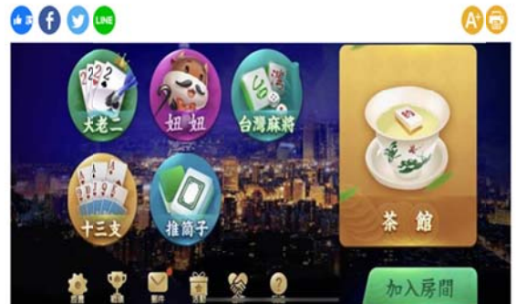
張男經營的「卡利娛樂城」線上博奕平台