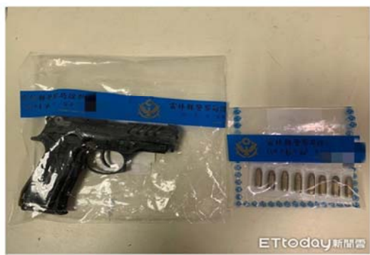
▲雲林縣警局刑警大隊接獲線報，蒐獲查獲簽賭非法持有改造金牛座JP935手槍1枝、子彈8顆，依違反槍砲彈藥組條例送辦。